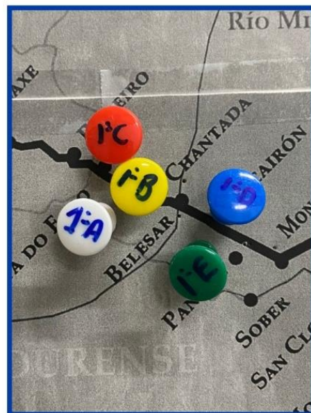
Detalle Etapas del 1er Curso de Primaria